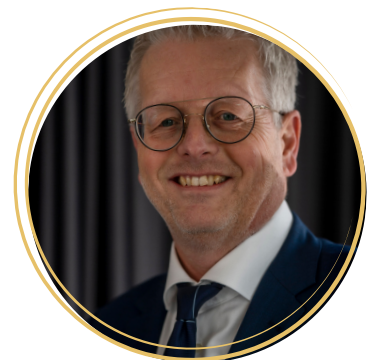
prof.dr. Jan Hamers

In deze bijdrage wordt ingegaan op de vraag hoe reeds beschikbare kennis kan bijdragen aan duurzame ouderenzorg. Het vertrekpunt is de stelling dat we al veel weten maar dat kennis vaak niet of onvoldoende wordt toegepast en uitgerold. Er wordt stil gestaan bij de rol die verzorgenden en verpleegkundigen kunnen hebben om dit proces te versnellen en verbeteren.