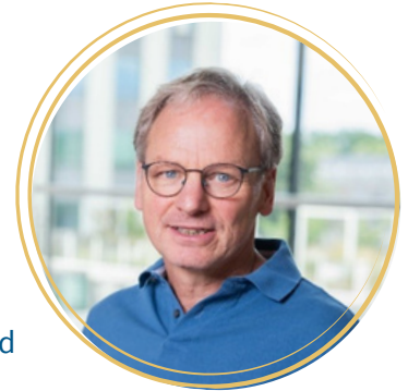
dr. Jurgen Claassen

Uit onderzoek blijkt er een verband tussen slecht slapen en dementie. Is slecht slapen een gevolg van dementie, of is het een oorzaak van dementie? Wat is 'slecht slapen' en hoe lang moet je dan slecht slapen om een verhoogd risico op dementie te hebben? Ik bespreek de meest recente literatuur, de bevindingen van onze eigen onderzoeken en ik ga in op lopend onderzoek. Ik noem ook kort hoe je slaap kunt meten, en wat je kunt doen aan slecht slapen.