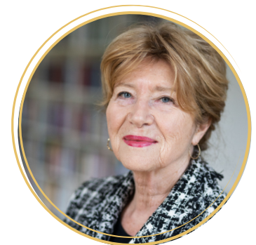
prof.dr. Myrra Vernooij

Social health is een van drie gezondheidsdomeinen die in 1946 door de WHO is benoemd, maar onderbenut is in het kader van langer leven, welbevinden, cognitief functioneren en dementie. Epidemiologisch onderzoek heeft de positieve invloed aangetoond van sterke social health op het verminderen van het risico op cognitieve achteruitgang en dementie en omgekeerd de verhoging van het risico hierop bij zwakke social health. Kwalitatief onderzoek heeft ons geleerd welke aspecten van social health van waarde zijn voor mensen met dementie. Hiermee zijn belangrijke aanknopingspunten ontdekt voor persoonsgerichte interventies binnen en buiten het verpleeghuis en voor public health interventies, zoals het belang van wederkerigheid in relaties. Het gaat hierbij niet om ingewikkelde interventies maar om het benutten van sociale mogelijkheden in alledaagse situaties.