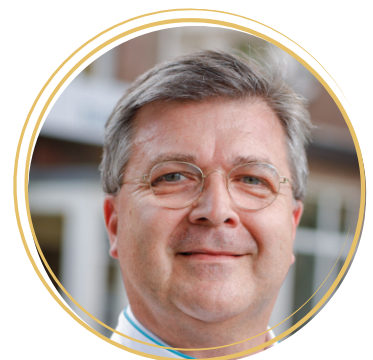
prof.dr. Kris Vissers

Pijn is een veel voorkomende multi-dimensionele ervaring die de kwaliteit van leven van een persoon en zijn omgeving ernstig kan beïnvloeden als deze chronisch wordt. Met een toenemende vergrijzing en doorgedreven curatieve zorg blijkt het niet eenvoudig te zijn om deze kwaliteit van leven tot op hoge ouderdom te blijven garanderen. Daarom kan een vroegtijdige interdisciplinaire proactieve benadering van problemen die vaak met chronische pijn gepaard gaan, nuttig zijn om meer ook op hoge ouderdom voldoende kwaliteit van leven en mobiliteit te garanderen. In de lezing zullen de nieuwste ontwikkelingen op het gebied van de pijngeneeskunde praktijkgericht toegelicht worden zowel op het gebied van de farmacologie, de pijnrevalidatie en de meer specialistische interventionele technieken.