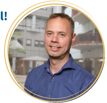
prof.dr. Richard Oude Voshaar

Ongeveer 1 op de 10 zelfstandig wonende ouderen heeft een persoonlijkheidsstoornis. In de volksmond wordt wel gesproken over 'mensen met een gebruiksaanwijzing'. Ondanks dat persoonlijkheidsproblematiek levenslang bestaat, kan dit ook op hoge leeftijd nog succesvol worden behandeld, als een ouderen hierdoor lijdt, vastloopt in interacties met anderen of juist de omgeving lijdt onder het gedrag. In deze presentatie laten we de resultaten zien van de eerste gerandomiseerde en gecontroleerde studie naar de effectiviteit van psychotherapie (nl. schematherapie) gericht op persoonlijkheidsproblematiek bij ouderen in de Nederlandse GGZ. Vervolgens maken we aan de hand van de voorlopige resultaten van onderzoek in het VVT-sector, de vertaalslag hoe de methodiek ook in het verpleeghuis ingezet kan worden voor de complexe ouderen. Hierbij gaan we kort in op de potentiële effectiviteit (case studie), gebruik en aanpassing van de schemavragenlijsten voor diagnostiek (psychometrische studie in de VVT), en mogelijkheden voor mediatieve behandeling (kwalitatieve studie).