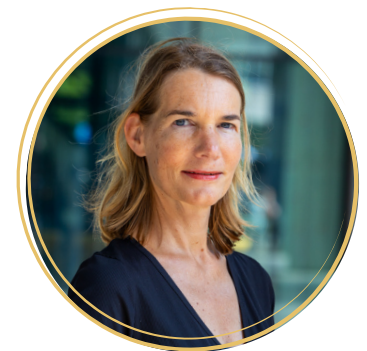
prof.dr. Yolande Pijnenburg

Frontotemporale dementie wordt gerekend tot een belangrijke oorzaak van dementie op jonge leeftijd, maar kan wel degelijk ook op oudere leeftijd voorkomen. De ziekte is heterogeen qua klinische presentatie, onderliggende pathologie en wat betreft erfelijkheid. Naast de bekende beelden met gedragsverandering of primair progressieve afasie kunnen op jongere leeftijd psychiatrische presentaties en op oudere leeftijd presentaties met geheugenstoornissen voorkomen. In deze voordracht wordt ingegaan op de herkenning van het klinische spectrum en de inbedding van FTD in het nationale JMD onderzoek.