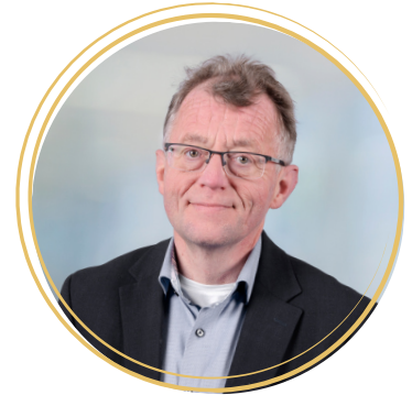
prof.dr. Sytse Zuidema

De inzet van sensortechnologie (domotica) bij mensen met dementie kan de zorgmedewerker helpen een goed beeld te geven van de gezondheidssituatie van de cliënt, en op die manier bijdragen aan persoonsgerichte zorg. In de presentaties gaan we in op het programma MOOD-Sense (monitoring onbegrepen gedrag bij dementie met sensortechnologie), een samenwerkingsproject tussen UMCG en Hanzehogeschool, zorgorganisaties in het UNO-UMCG en bedrijven. MOOD-Sense richt op vroege opsporing van onbegrepen gedrag bij dementie met omgevings- en aan het lichaam gedragen sensoren. Vroege opsporing van onbegrepen gedrag en/of onderliggende factoren maakt tijdige inzet van interventies door het zorgteam mogelijk, om verdere ontsporing van gedrag te voorkomen.